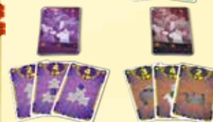
32 cartes Goûts du public