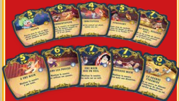
Exemple de tuiles Défis Fun & Technique