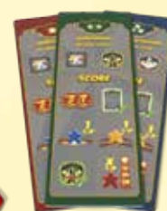
3 tuiles Score