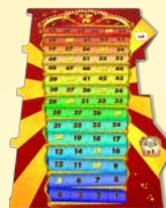
1 plateau de jeu : L'applaudimètre