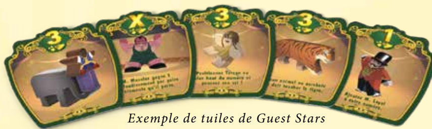
Exemple de tuiles de Guest Stars

Chaque Guest Star fera gagner des applaudissements si elle est utilisée de la bonne manière.