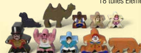
10 meeples Guest Star + 2 planches d'autocollants (recto / verso) L'Otarie - Le Chameau - Le Cornac - Tarzan - L'Équilibriste M. Loyal - M. Muscles - La Cavalière de l'extrême - Le Clown - Le Tigre