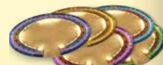
5 pistes de Cirque (recto / verso)