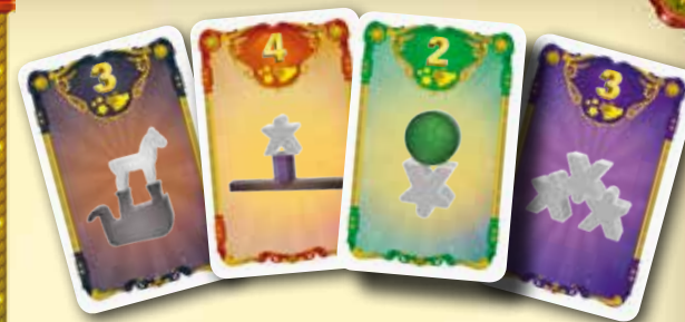
Exemple de cartes Goûts du public

Rangez la tuile Score dans la boîte pour faire apparaître la suivante.