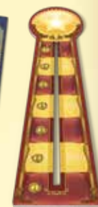
1 réglette de mesure de hauteur